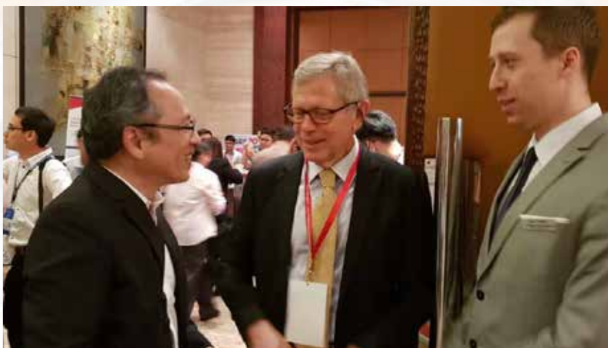
茶歇时间摊位拜访热络，交流踊跃